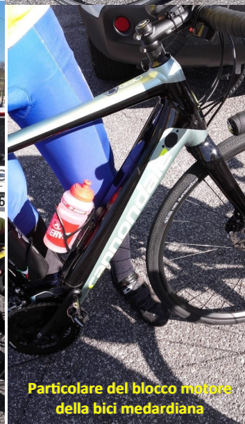
Particolare del blocco motore della bici medardiana