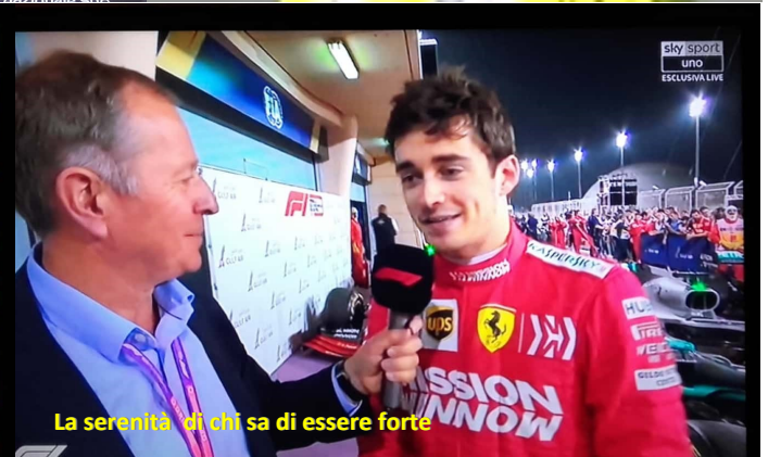
La serenità di chi sa di essere forte