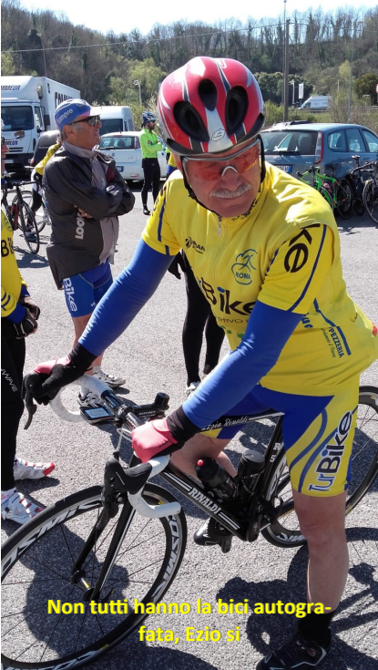
Non tutti hanno la bici autografata. E'io sì