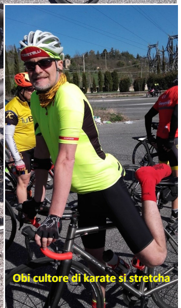
Obi cultore di karate si stretcha