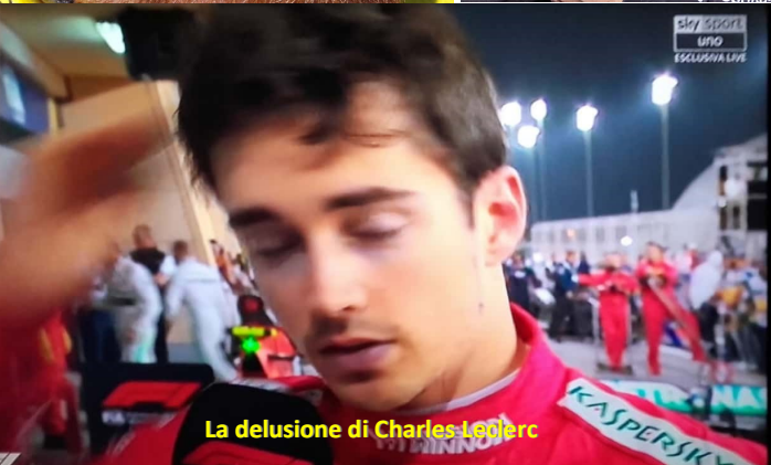
La delusione di Charles Leclerc