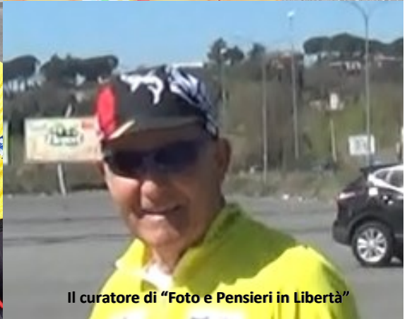
Il curatore di "Foto e Pensieri in Libertà"