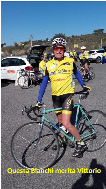
Questa Bianchi merita Vittorio