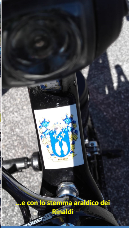
...e con lo stemma araldico dei Rinaldi