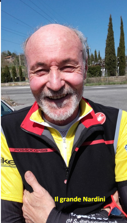
Il grande Nardini